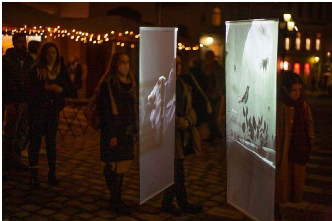
Protilátka/Torso (Café Pilát)