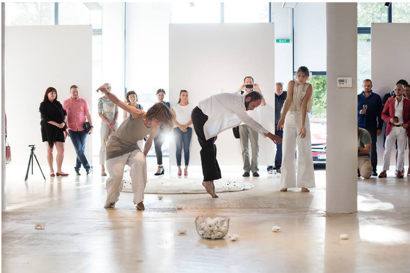
Performance k výstavě A. Klimešové „Takto to už nebude“.