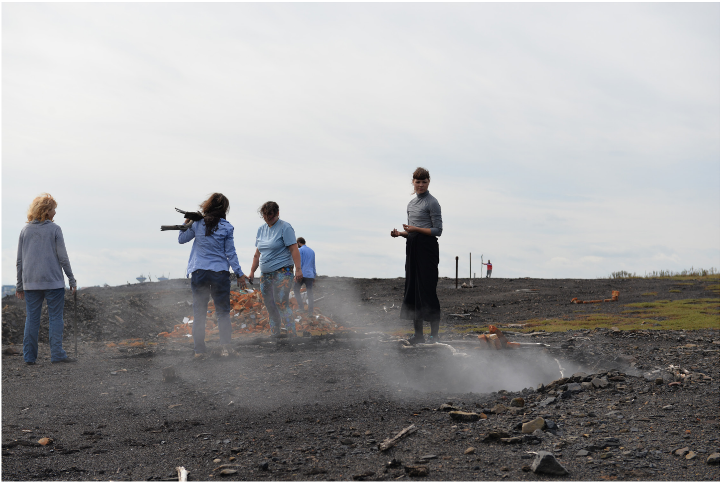
Dotknout se haldy