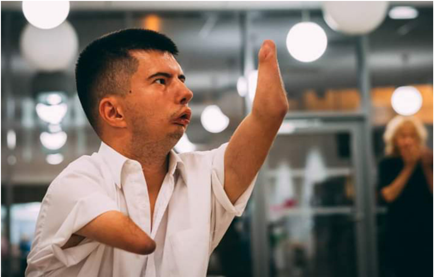
Dva z Kafky